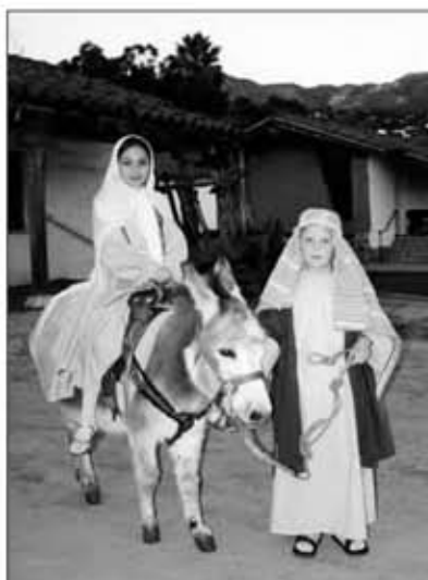
Una Noche de Las Posadas